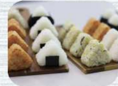
可對應各種要求而改變飯糰形狀